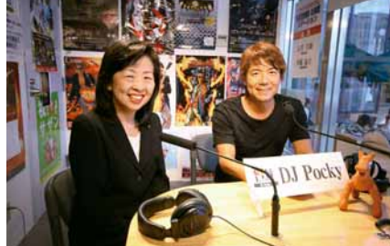
DJ Pockyとの楽しいトークが人気のFMかごしま「おしえてウエディングステーション」は、毎月最終水曜17時30分頃からオンエア