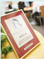
信頼のおけるBIA(公益社団法人日本ブライダル文化振興協会)の会員店

「何からどうすればいいのかわからない」という段階から何なりとご相談ください。「ウエディングステーションに来て本当に良かった」。そう思っていただけのように全力でサポートさせていただきます。