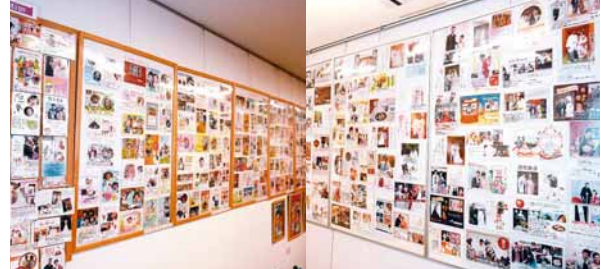
利用者からの喜びの声が溢れたハガキがずらりと並ぶ店内。その一枚一枚にスタッフへの感謝の声が綴られている