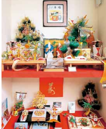
結納は和婚の伝統を受け継ぐ大事な儀式。だからこそ、きちんと対応してくれる信用できる店を選びたいもの。結納用品に関してもスタッフまで気軽に問い合わせを